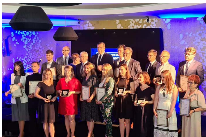
Kryształowe Serce Radcy Prawnego