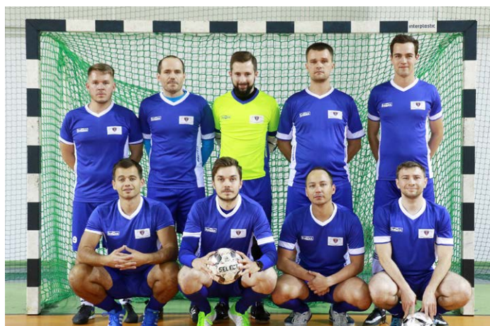
Reprezentacja Okręgowej Izby Radców Prawnych w Piłce Nożnej Halowej